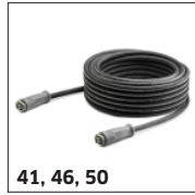
41, 46, 50