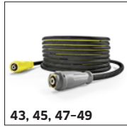
43, 45, 47-49