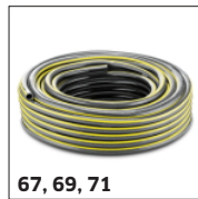
67, 69, 71