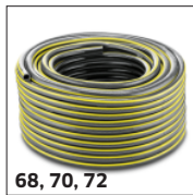
68, 70, 72