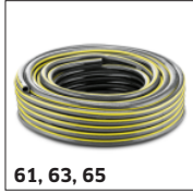
61, 63, 65