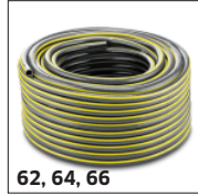
62, 64, 66