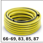
66-69, 83, 85, 87