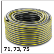
71, 73, 75