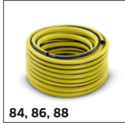
84, 86, 88