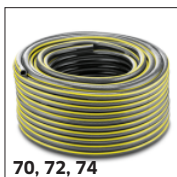
70, 72, 74