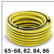
65-68, 82, 84, 86