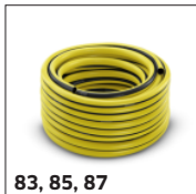
83, 85, 87