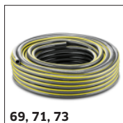
69, 71, 73