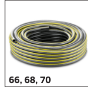
66, 68, 70