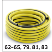
62-65, 79, 81, 83