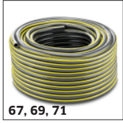
67, 69, 71