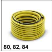
80, 82, 84