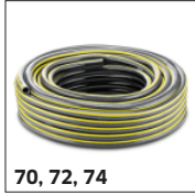
70, 72, 74